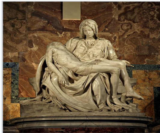
Michel-Ange fin XVe siècle